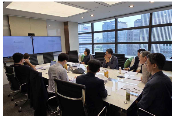
<The Best ESG 심사위원 심사>