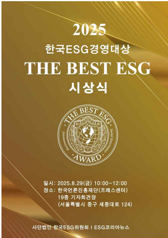
<The Best ESG 시상식 리플렛>