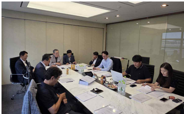
<The Best ESG 심사위원 심사>